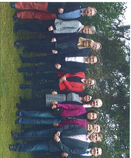
Das Team der Niedersächsischen Arbeitsgerichte

Für weitere Fragen stehen wir Ihnen gerne zur Verfügung.